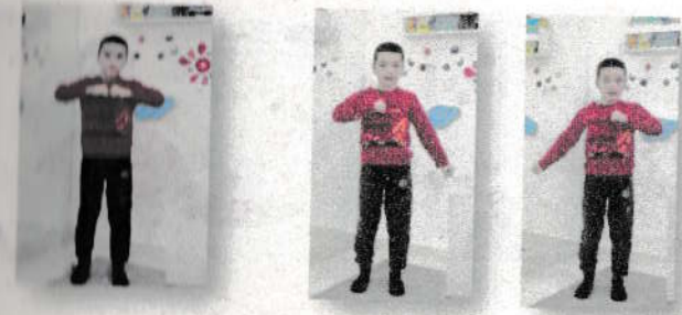
4-rasm. T tovushining holati

Dastlabki holat. bir vaqtning o'zida ta, ta bo'g'imlarini talaffuz qilish bilan mushit bo'lib siqilgan o'ng va chap qo'l bilan pastga keskin harakatlar (zarbalar kabi) Harakat tarang, kuchli, qisqa (4-rasm).