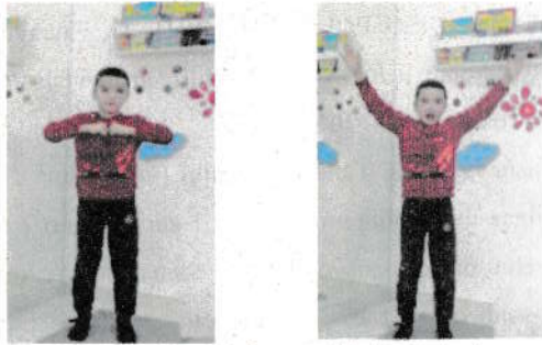
1-rasm. A tovushining holati

Dastlabki holat. Chuqur nafas olish, bir vaqtning o'zida uzoq vaqt davomida a__ ni talaffuz qilish bilan qo'llarni tepaga yon tomonlarga yoyish. Eslatma. Hozirda va bundan keyin ____ (a____) belgisi uning cho'zilgan talaffuziga mosdir. Harakat quyidagilar bilan tavsiflanadi: taranglanish bo'shashgan; intensivligi - kuchsiz; vaqt bo'yicha - uzoq (1-rasm).