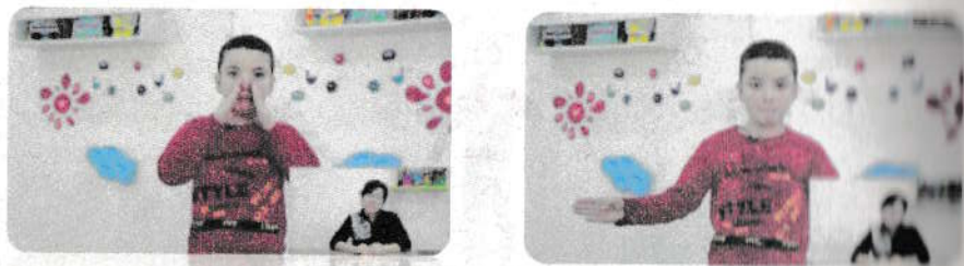
6-rasm M tovushining holati

Dastlabki holat. Barmoqlaringizni buruningizga ko'taring, m ___ ni talaffuz paytida qo'llaringizni yumshoq, ohista harakat bilan yon tomonlarga yoying. Harakat biroz tarang, kuchsiz, qisqa, (6-rasm).