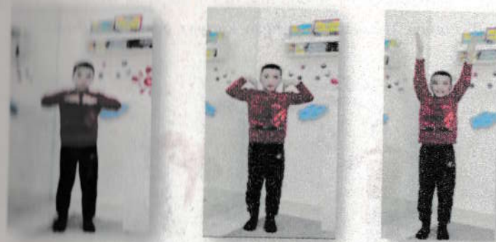
7-rasm I tovushining holati

Dastlabki holat. Chuqur nafas olib, bir vaqtning o'zida i ___ ni talaffuz qilib qo'llar yuqoriga ko'tariladi. Harakatlar bo'shshagan, kuchsiz, chozilgan (7-rasm).