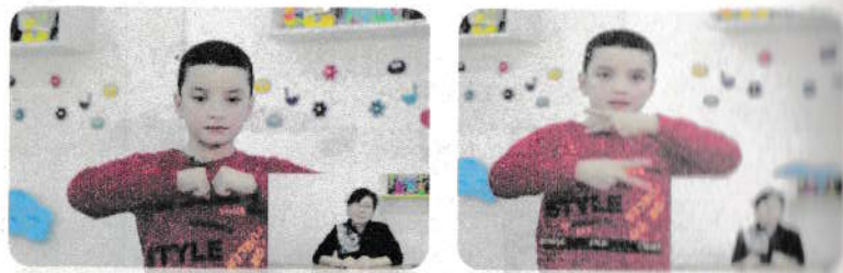
5-rasm L tovushining holati.

Dastlabki holat. La, la, la ... bo'g'inarini talaffuz qilayotganda qo'llaringizni ko'kragingiz oldida aylantiring. Harakat biroz tarang, kuchsiz, qisqa (5-rasm).