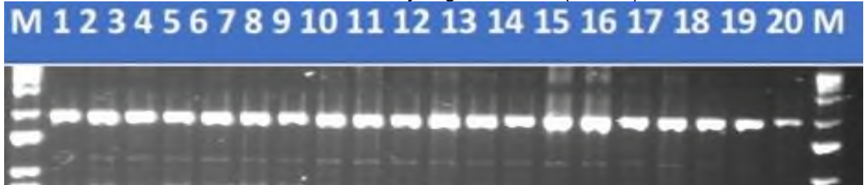
3-rasm. Nav namunalarining sifatga javob beruvchi umumiy oqsil belgilovchi NAM-B1 markeri bilan PZR tahlilining gel-elektroforegrammasi.

NAM-B1 geni uchun bug'doy o'simliklarining DNK namunalarida PZR o'tkazildi, so'ngra 1,5% agaroz gelida elektroforez o'tkazildi. NAM-B1 genini PZR mahsulotlarining elektroferogrammalari tahlili barcha 20 namunalarda PZR mahsulotlari mavjudligini ko'rsatdi (3-rasm).