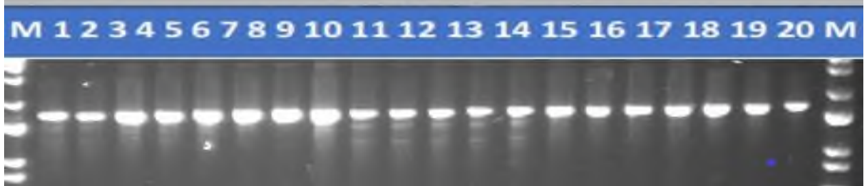
3-rasm. Nav namunalarining sifatga javob beruvchi umumiy oqsil belgilovchi NAM-A1 markeri bilan PZR tahlilining gel-elektroforegrammasi.

NAM-A1, NAM-B1, NAM-D1 genlari uchun bug'doy o'simliklarining DNK namunalarida PZR o'tkazildi, so'ngra 1,5% agaroz gelida elektroforez o'tkazildi. NAM-A1 genini PZR mahsulotlarining elektroferogrammalari tahlili barcha 20 namunalarda PZR mahsulotlari mavjudligini ko'rsatdi (2-rasm).