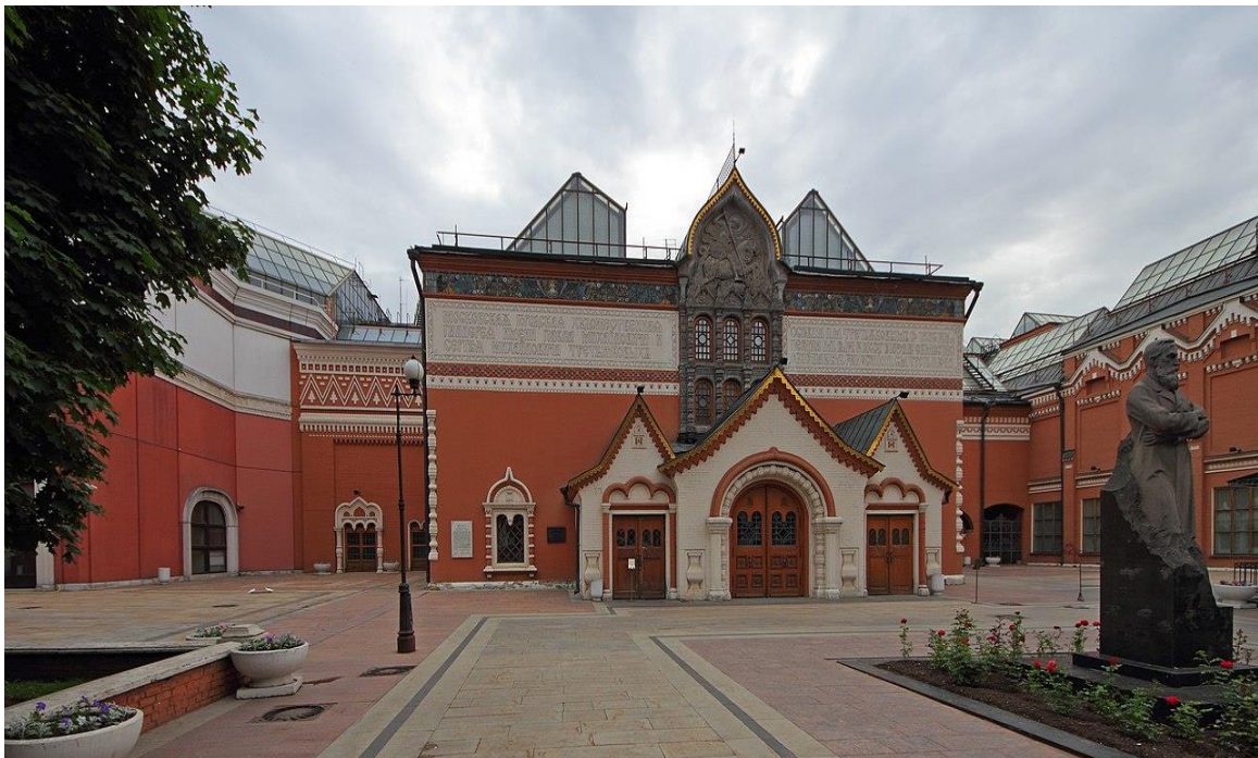
Здание Третьяковской галереи, 2008 год