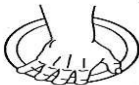
1-расм. Дискни ушлаш усули

Дискни тутиш. Диск, пастга туширилган кўлнинг бош бармоқдан ташқари букилган бармоқларидаги тирноқ бўғимига таяниши керак. Бош бармоқ фақат диск юзасига тегиб туради. Бунда панжа кафт-билак бўғинида сал букилган бўлиб, диск гардишининг юқори қисми билакка тегиб туради. Бармоқлар бир-бирига яқин бўлмаслиги, таранг ёзилган ҳам бўлмаслиги керак, чунки ҳар иккала ҳолда ҳам дискни бошқариш қийинлашади (1-расм).