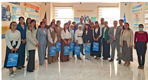
Gruppenfoto von der Sommerschule.