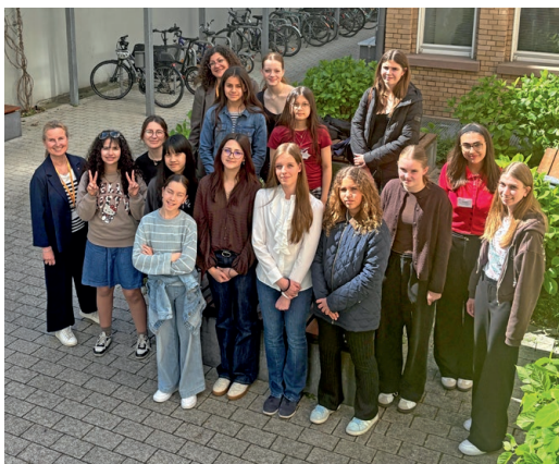
Die Teilnehmerinnen des Girls'Days mit Beteiligten aus dem IDS.