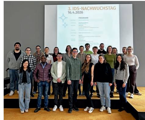
Gruppenfoto vom 3. IDS-Nachwuchstag

hat. Das Programm ist online weiterhin einsehbar. Vielen Dank allen Gästen für ihre Teilnahme und ihr Interesse, allen Beteiligten für ihre spannenden Einblicke und den Austausch sowie unserem IDS-OrganisationsTeam für die Planung und Durchführung!