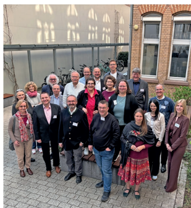
Gruppenfoto der Teilnehmenden.