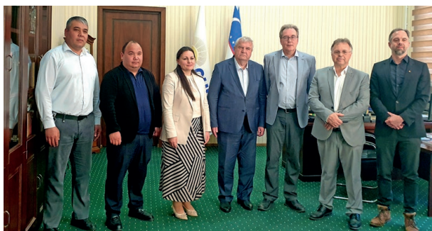
Die Mitwirkenden des IDS beim Rektor der Universität Chirchik

Die Sommerschule wurde ergänzt durch einen thematisch ähnlichen Kurzworkshop an der Staatlichen Universität Buchara. An beiden Universitäten wurde mit den Rektoren die Fortsetzung der Kooperation für weitere fünf Jahre beschlossen.