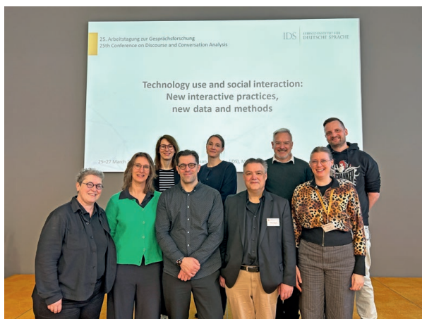
Gruppenfoto der Keynote-Speaker und des Organisationsteams