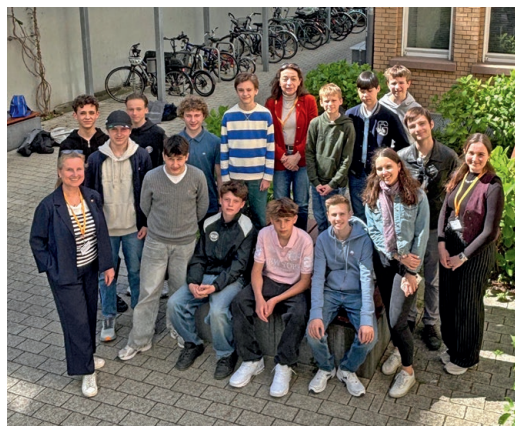
Die Teilnehmer des Boys'Days mit Mitwirkenden aus dem IDS.